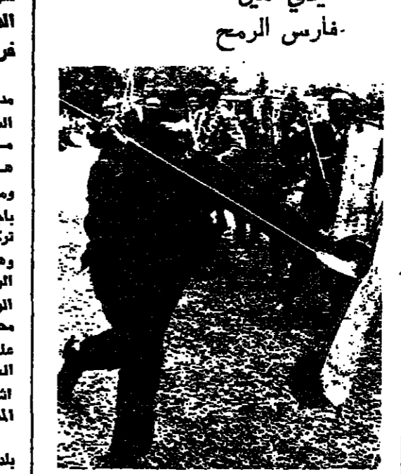
عدي امين فارس الريح. عدي امين فارس يرمي الريح ويقل التصدي (الصورة). وقد حصل ذلك في العيد التقليدي للاميرال امين الذي احتفل بالعيد الثاني لتسلمه السلطة. وفي هذه المناسبة قال الرئيس امين: لقد طليت من وزدي ان يشاركوني هذه الرقصة. وانتمى ان يكون كل ذلك فرحا في الاجتماع اقبل لعضاء دول الكونكول في لندن.